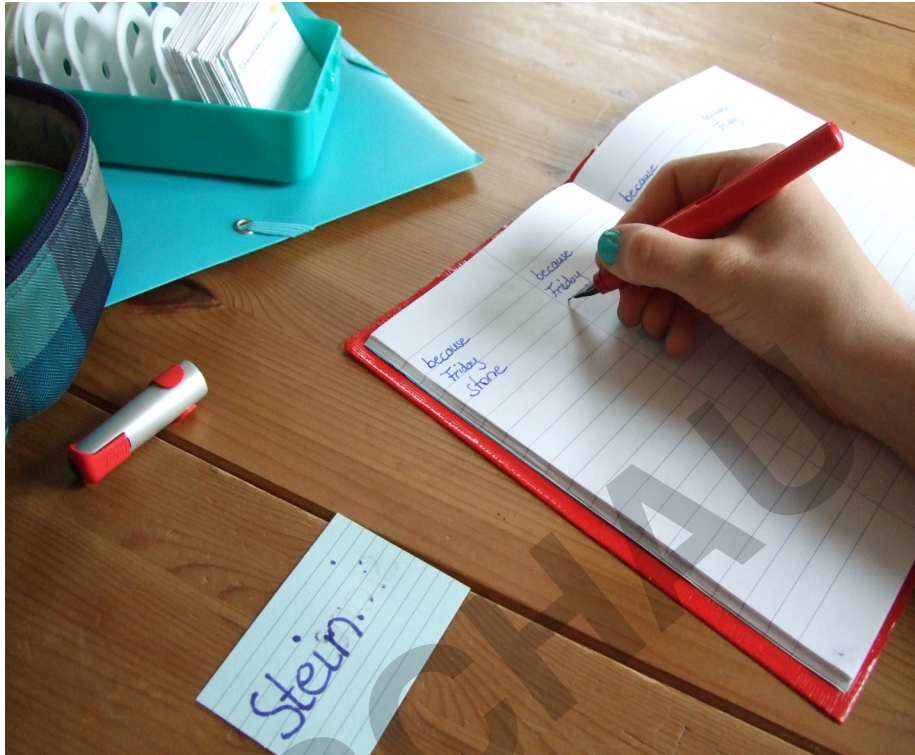
Abb. 2: Ein 2-spaltiges Vokabelheft 4-spaltig nutzen